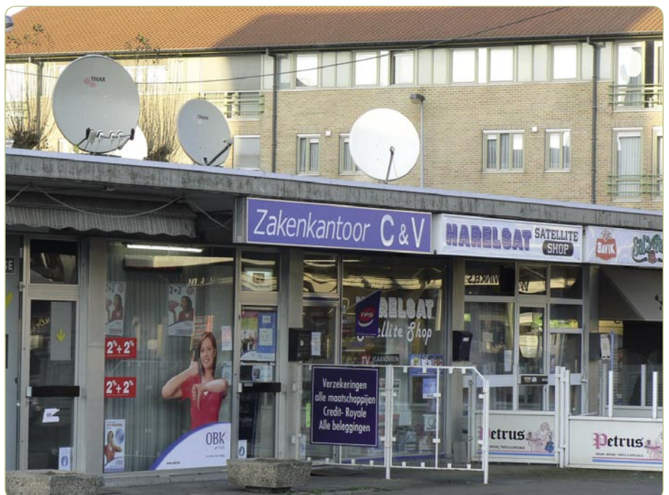
De kleine Haralsat winkel – geopend van dinsdag tot en met zaterdag van 9 am tot 7 pm en met een assortiment aan complete satellietpakketten.

De BSH club heeft ook in het verleden een aantal beurzen georganiseerd, waarbij de meest recente meer dan 10 exposanten trok – inclusief satelliet en kabelaanbieders – en 500 bezoekers in 2006. Een volgende beurs staat gepland voor mei 2007, die ruimte biedt voor 20 exposanten. Dit alles toont aan dat België dan misschien wel een kleine markt is, maar dat deze wel bijzonder actief is in de satellietwereld.