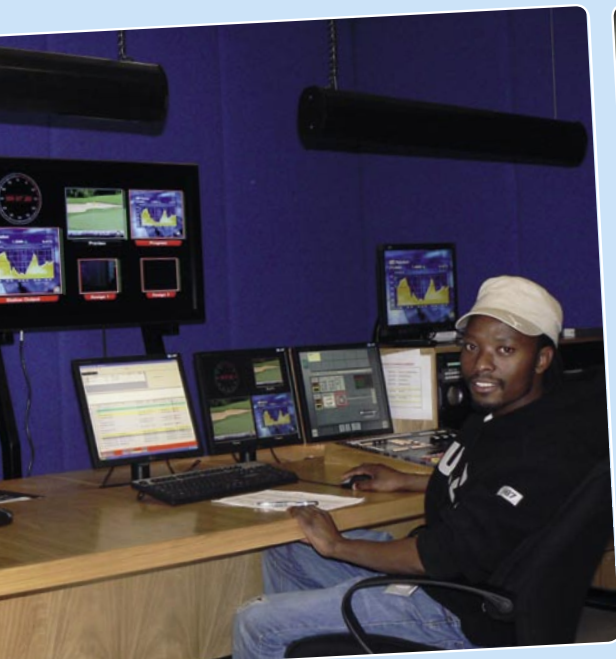
Operatoren in het controlecentrum. Al naar de satellieten.

Ze plannen ook om door te gaan met FTA uitzendingen om zo veel mogelijk kijkers te bereiken. Ze zijn zeer ambitieus!