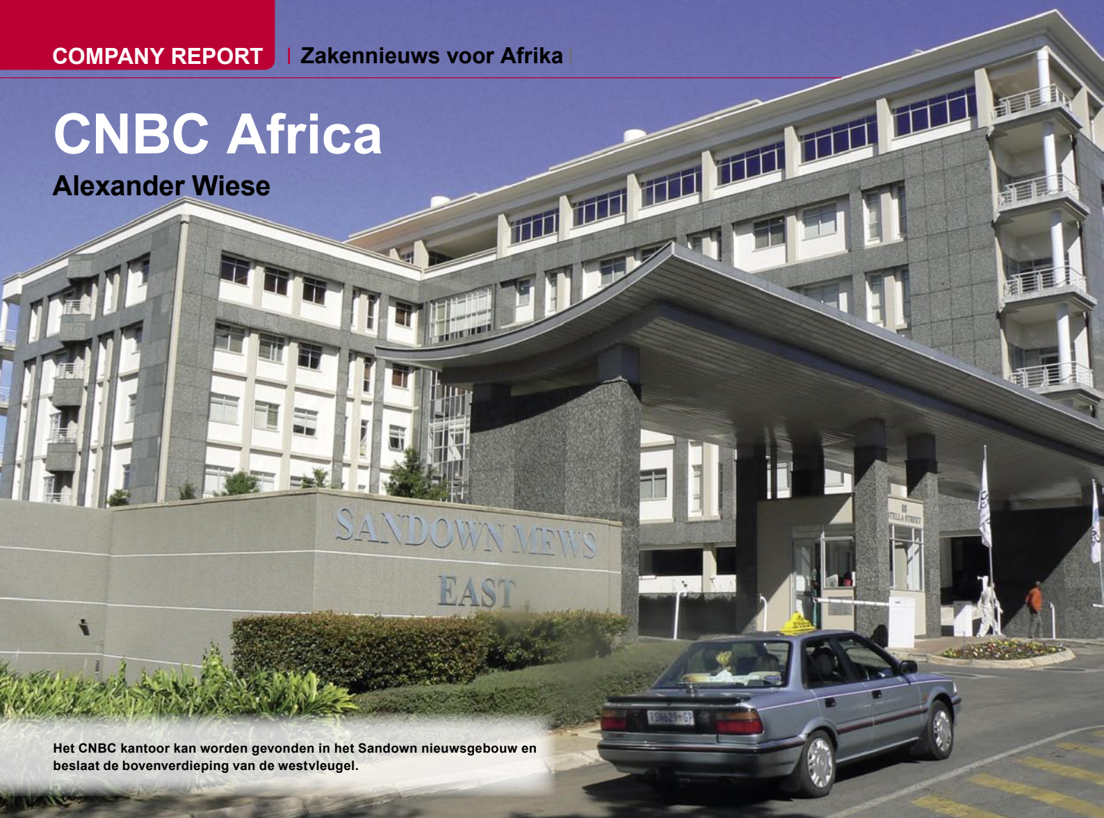
Het CNBC kantoor kan worden gevonden in het Sandown nieuwsgebouw en beslaat de bovenverdieping van de westvleugel.