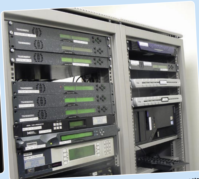
Hier worden de signalen verwerkt. De Tandberg slots zijn voor satellietoperaties. De slots voor de terrestriale microgolven zijn gelinkt naar SENTECH, de Zuid-Afrikaanse serviceprovider voor de distributie van signalen.