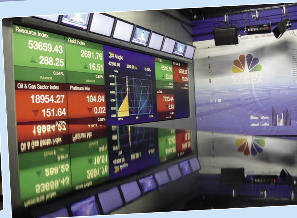
Een blik in de CNBC studio