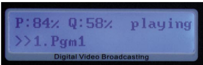
Speelt Pgm1 |

Na het openen van het submenu "gebruikersinstallatie" kun je alle relevante parameters van de transponder en van de LNB die je gebruikt instellen. Alles is nogal basaal. Je kiest bijvoorbeeld niet de polarisatie van het signaal maar de LNB spanning (UIT, 14