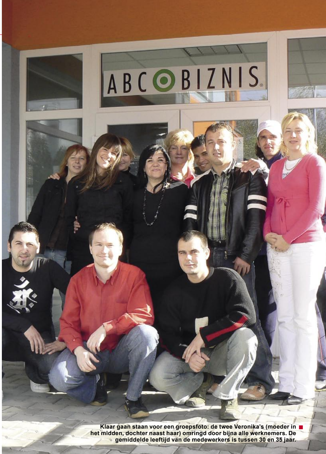
Klaar gaan staan voor een groepsfoto: de twee Veronika's (moeder in het midden, dochter naast haar) omringd door bijna alle werknemers. De gemiddelde leeftijd van de medewerkers is tussen 30 en 35 jaar.

De ontwikkeling van ABC BIZNIS is enorm omhooggeschoten sinds 2004. In die tijd bedroeg de omzet in euro's maar 0,5 procent van de totale omzet, vergeleken met 40,5 procent in 2008.