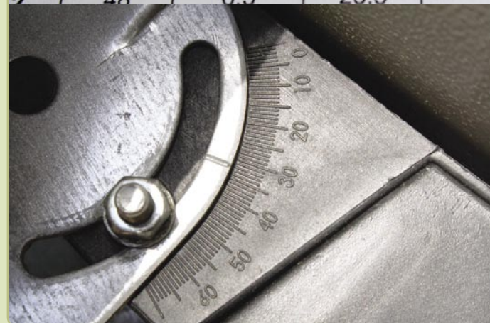
■ (Figuur 3) Uittreksel uit een tabel en antenne declinatieschaal

lengtegraad aan en maak de schroeven vast (figuur 2).