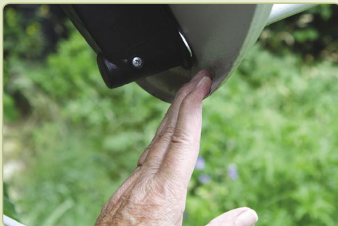
■ (Figuur 4) Zijdelingse schotelafstelling

Gebruiksaanwijzing slechts in het Engels Maximaal 60 graden oost/west motorbeweging